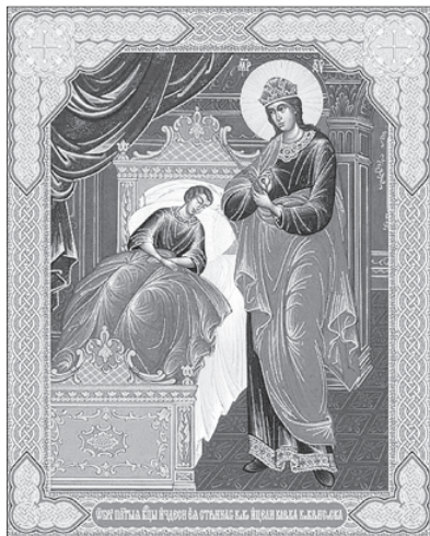
Икона Божией Матери «Целительница». Современная икона.