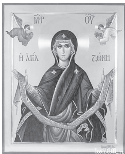
Покров Пресвятой Богородицы. Современная икона.

11 октября — Прпп. схимонаха Кирилла и схимонахини Марии († ок. 1337 г.), родителей прп. Сергия Радонежского. Собор преподобных отцов Киево-Печерских, в Ближних пещерах (прп. Антония) почивающих.