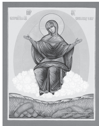
Икона Божией Матери «Спорительница хлебов». Современная икона.

28 октября — Димитриевская родительская суббота. Иконы Божией Матери «Спорительница хлебов».